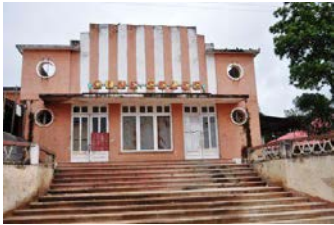
Art deco em Seles