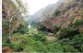
En route Sassa