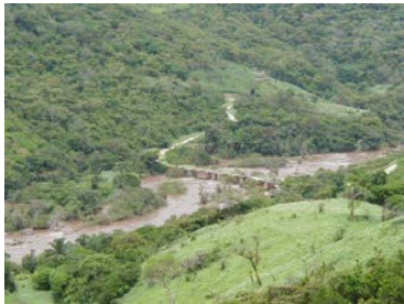
Views of Queve

Apos o nosso sumptuoso pequeno almoço, faremos uma breve visita a fazenda e depois seguiremos para as termas de Tocota. A seguir vamos visitar as Cachoeiras da Binga onde (ou) teremos um piquenique, (ou) continuaremos para Porto Amboim onde teremos um almoço ao lado do mar dependendo no tempo disponível). Deveríamos chegar a Luanda entre 19:00 – 20:00 (dependendo no transito).