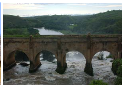
Rio Keve – the old bridge