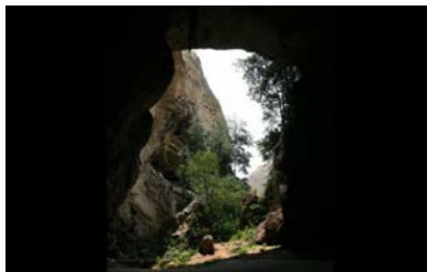
Grutas de Sassa Caves and views