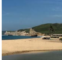
Praias de Porto Amboim