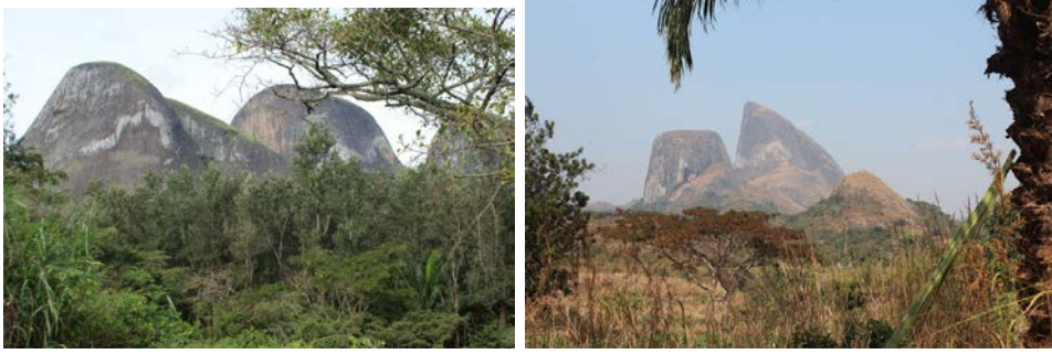
Vistas da Serra de Kumbira