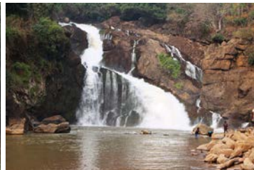
Cachoeiras / Binga Falls