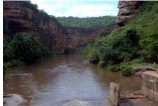
Rio Cubal Canhao Kikombo