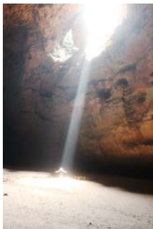
Grutas Sassa