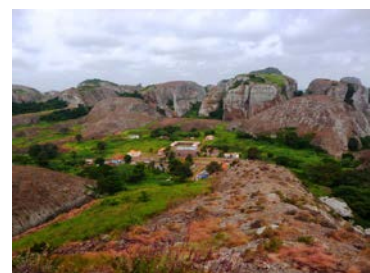
Vistas de Pedras Negras (Pungo Andongo)