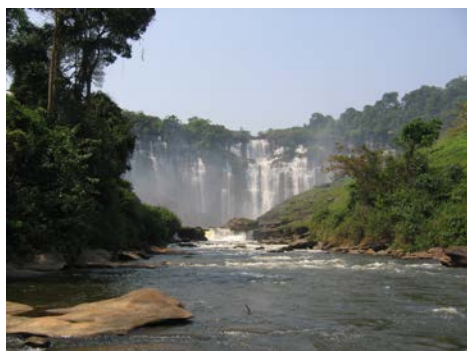
Quedas Kalandula vista de baixo* (tragam botas !)

*no passeio de apenas 2 dias nem sempre ha tempo /condicoes para descer..