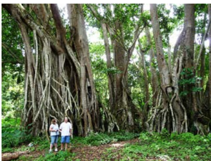
Jardim Botanico N'dalatando

Acomodação: Hotel basico em Kalandula Refeições incluídas – Almoco, jantar.