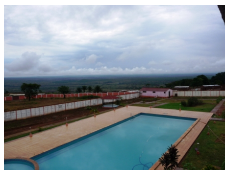
Vista do Hotel Kalandula

*no passeio de apenas 2 dias nem sempre ha tempo /condicoes para descer..