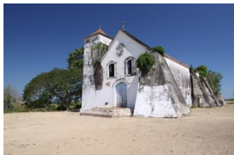
Igreja "Nossa Senhora Victoria"