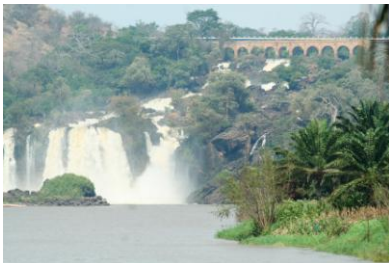
Quedas do Binga "Cachoeiras"