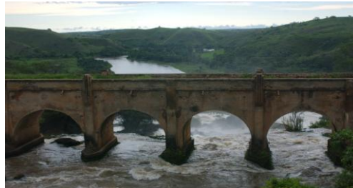
Ponte do Rio Kweve

Refeições incluídas: Café da manhã e almoço