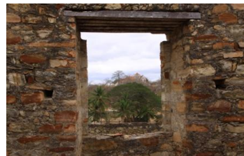
Ruínas de Massangano