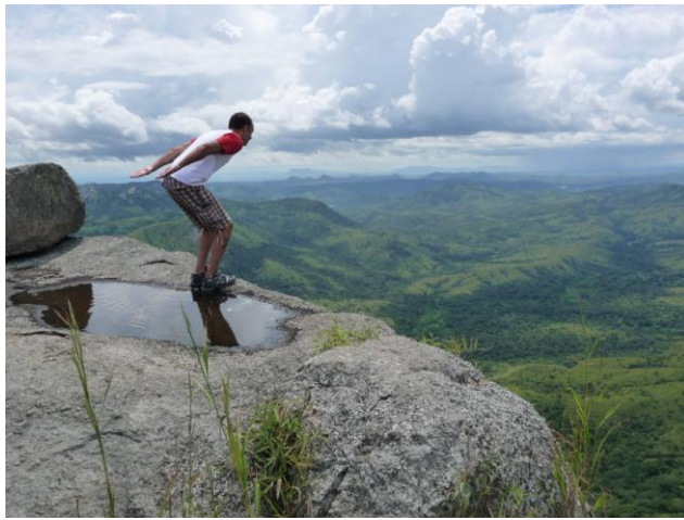
Nao faca isso! 300 graus de vista da fazenda de café