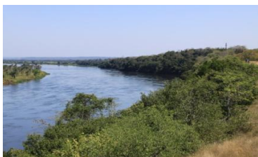
Rio Kwanza - Massangano

Hospedagem: Fazenda Cabuta ou Hotel Ritz Calulo ou Tia Ka (dependerá da disponibilidade de tempo) Refeições incluídas - almoço, lanche e jantar