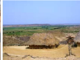
Views of Keve