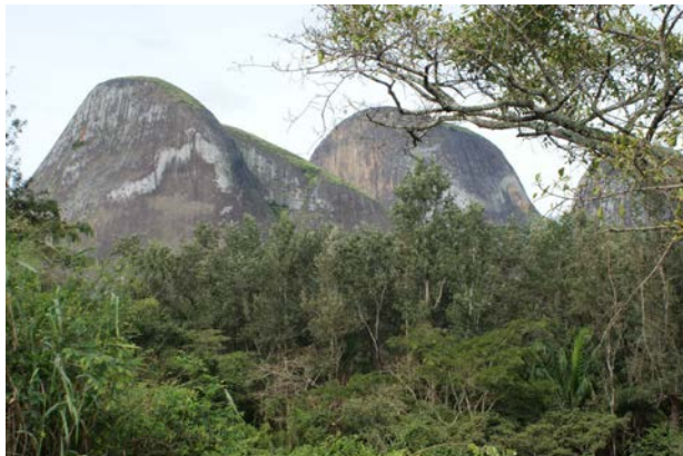
Farm / Kumbira Escarpment views