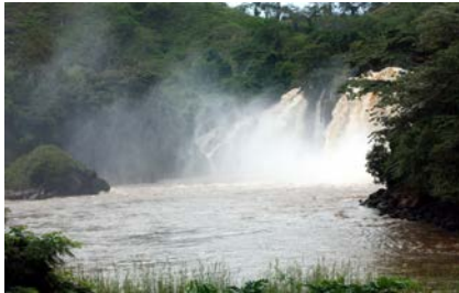
Cachoeiras / Binga Falls