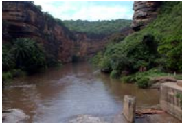
Rio Cubal Canyon

Após o pequeno almoço, faremos um breve visita ao fazenda, e logo a seguir passaremos na Vila Nova de Seles. Apos, seguiremos para a costa e a sul para visitar uma garganta provocada pela erosão do Rio Cubal. Seguiremos depois em direção norte à foz do Rio Queve onde permaneceremos algum tempo para desfrutar das paisagens que o lugar nos oferece (sujeito a condições locais). Seguiremos depois ara Porto Amboim para almoçar e de seguida partimos para Luanda com chegada prevista para aproximadamente as 19:00 – 20:00.