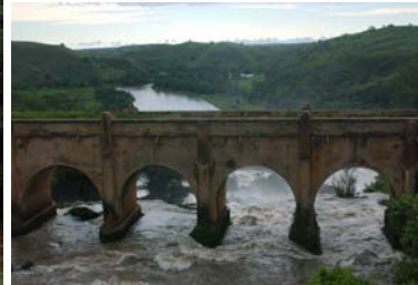
Rio Keve – the old bridge