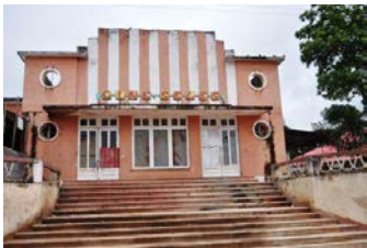
Art deco in Seles