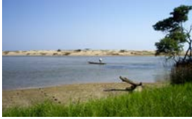
Rio Queve Estuary views