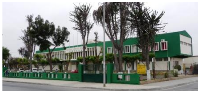
“Ferrovia - Lobito Sports Club” Restinga Lobito