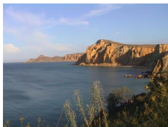
Paisagem das praias do sul

Depois do pequeno almoço, faremos um passeio turístico pela cidade do Lobito e Catumbela no caminho para por Benguela (reconhecida pela sua arquitectura e avenidas largas) em direcção a sul, onde visitaremos o Parque de Chimalavera, com a sua savana semi desértica, que está a ser reabilitado e repovoado. Visitaremos depois as famosas praias da Caota e Baía Azul onde sera servido um almoço buffet numa esplanada na praia. Depois do almoço regressaremos ao Lobito para quem quiser, um pequeno passeio a pé pelo largo da Administração e do legendário Hotel Terminus e da ponta da Restinga, onde apreciaremos o pôr do sol. Jantar no nosso hotel.