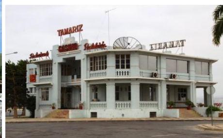
Art deco no Lobito – Restaurante Tamariz