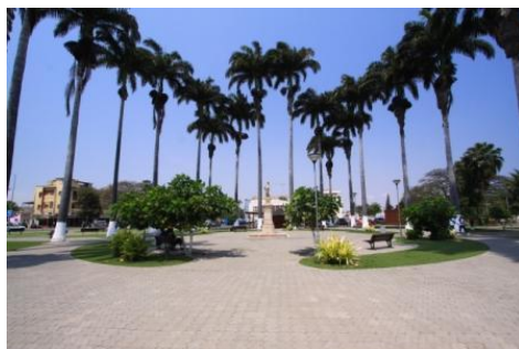
Largo da Administração BENGUELA