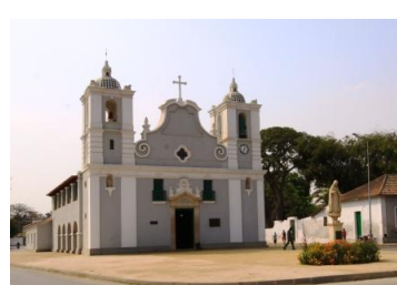
Igreja de N. Sra do Pópulo