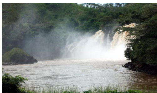
Cachoeiras de Binga

Partida de Luanda cedo, viaja-se ao longo da costa pela Estrada Nacional Nº 1. Depois de atravessarmos a ponte do Rio Kwanza passaremos pelo Parque Nacional da Quissama até chegarmos ao seu limite sul - Rio Longa. Atravessada a ponte encontramos na Província do Kwanza Sul e uma paragem para café será feita em Porto Amboim. Prosseguiremos a viagem para as Cachoeiras do Binga e em seguida partimos em direcção a Sumbe onde paramos para almoço* (*obs dependendo do tempo disponível poderíamos optar para um pique nique nos Cachoeiras *). De seguida, continuaremos a Lobito onde chegaremos na fim de tarde. Faremos check in no nosso hotel para um merecido descanso e jantar.