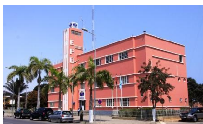
Art Deco – Edifício da Rádio benguela