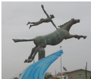
Estátua Lobito (Canhão Bernardes)