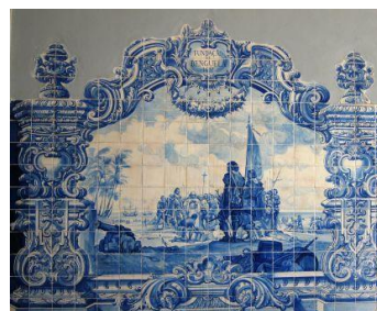
Azulejos em Benguela