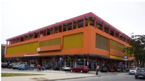
Mercado do Lobito

Depois do pequeno almoço poderá haver um tempinho livre para um passeio na Restinga ou um ultimo mergulho. Logo a seguir partiremos para o nosso regresso a Luanda via Sumbe e Porto Amboim (aonde almocaremos).