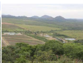
Vistas lindas da Fazenda de Vinho da Xixila e arredores.