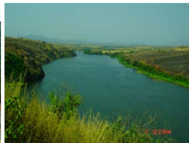
Albufeira da Barragem de Cambambe