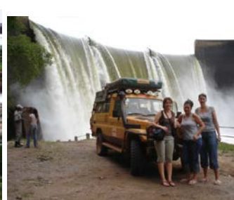
“Paredão” Cambambe (sendo aumentado agora)

Refeições: Pequeno-almoço e almoço “snack”