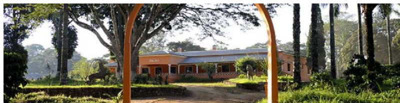
Recepção na Cabuta