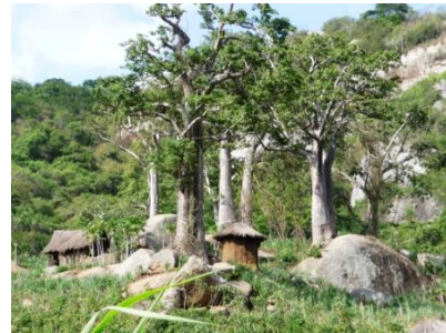
Aldeia bonita na “Floresta de Magia”