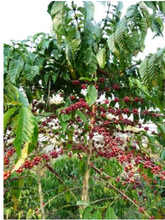
Mmm tais “feijões vermelhos” que todos nós amamos tanto!