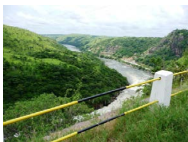
Rio Kwanza no Cambambe