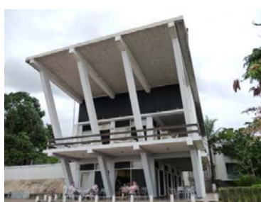
Arquitetura interessante na Pousada