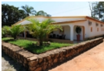
Restaurante na Cabuta