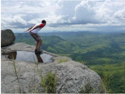
Não faça isso! Don't do it! - Sendo seduzidos pela incrível vista de 300 graus

Refeições: Pequeno-almoço, almoço e jantar