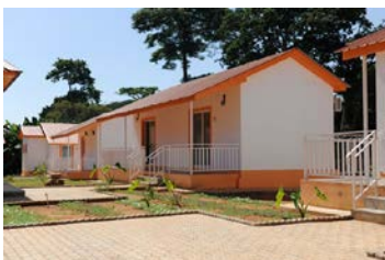
Na “Sanzala” bungalows (en suite+ar con)