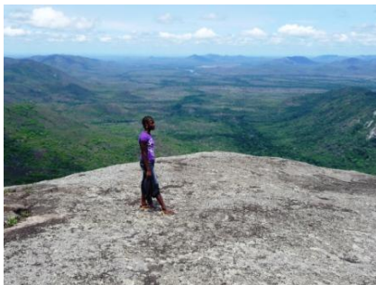
Índia (guia) acima da “Pedra do Balão”