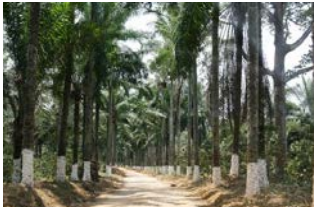
Fazenda Cabuta - Entrada (“Ave Palmeiras”)