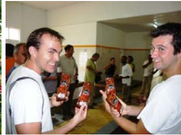
Na turnê de café guiada da fazenda de café