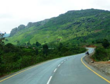
En route – vistas espetaculares Kwanza Sul