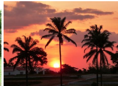
Por do Sol na Fazenda