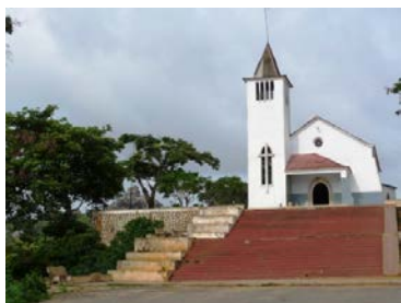
Igreja em Calulo (Dia 2)

Depois do almoço teremos algum tempo livre, então vamos retomar a estrada e voltar para Luanda através das colinas e montanhas do Kwanza Sul. Pararemos para almoçar e visitar a Barragem de Cambambe (a represa mais antiga no Rio Kwanza) que foi acabado ao final dos anos 50 e ainda trabalha com as turbinas originais fabricadas na Suíça. Se podemos obter a permissão, iremos visitar a barragem em si*. *OBS - como a barragem está a sofrer obras de reconstrução neste momento (a paredão está sendo aumentada), isso poderia ser difícil de organizar, mas vamos fazer tudo o que pudermos para chegar lá. Aqui teremos um lanche almoço antes de voltar para Luanda via Dondo.